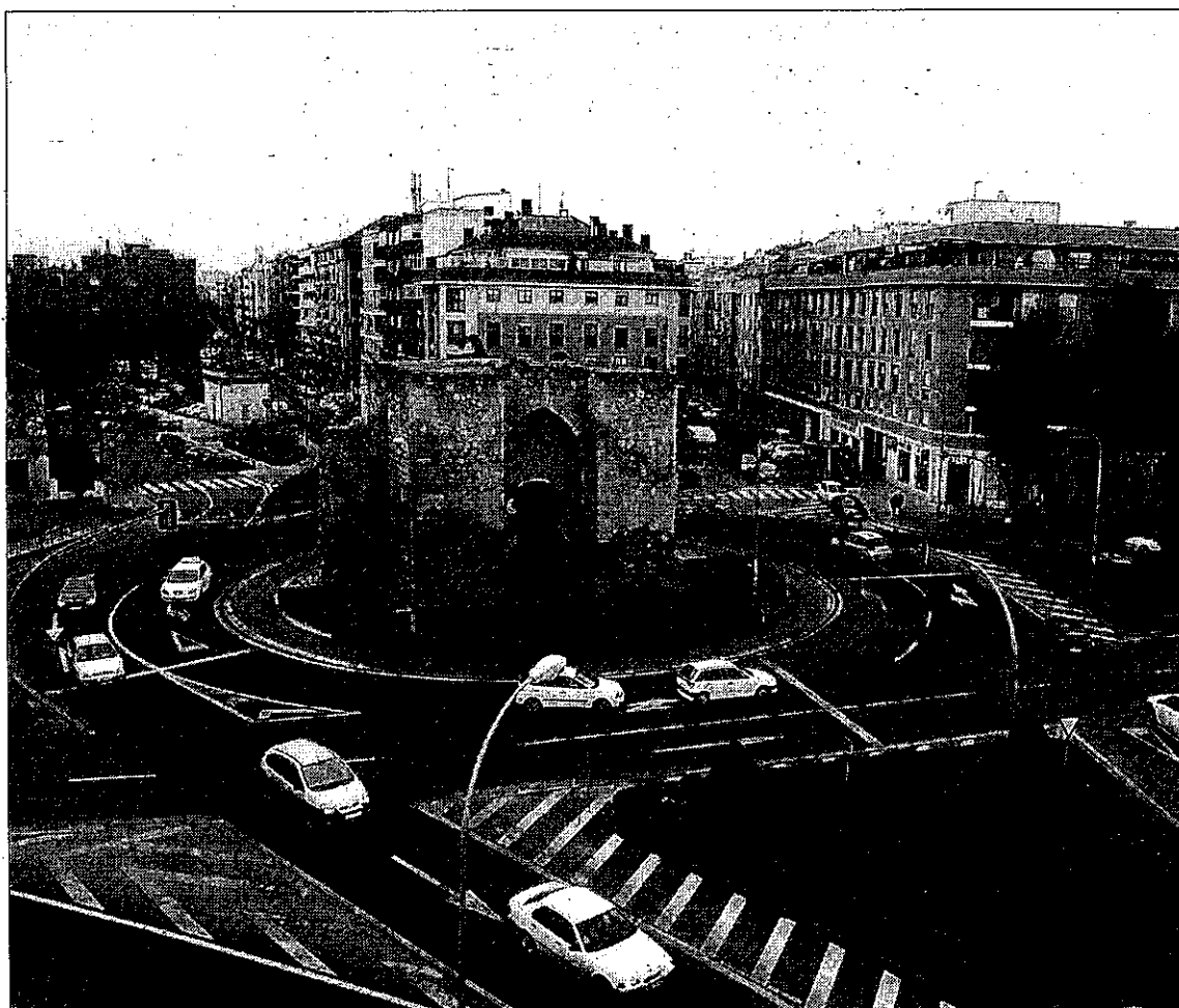
La Puerta de Toledo y su entorno serán sometidos a una rehabilitación integral. / SERVICIO ESPECIAL

La segunda fase se centra en la restauración de la Puerta de Toledo y el reconocimiento del valor